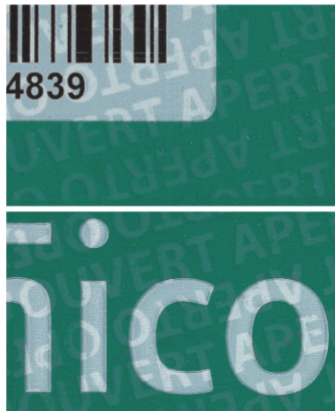
Abbildung 3: Beschädigtes Siegelband