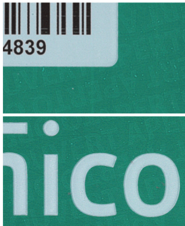
Abbildung 2: Unbeschädigtes Siegelband

Die Abbildung 1 zeigt die Vorderseite der Verpackung eines ORGA 6141 online mit einem ungeöffneten und unbeschädigten Siegelband. In regelmäßigem Wechsel ist auf dem türkisgrünen Siegelband das Ingenic Healthcare Logo und ein Barcode mit der Siegelbandnummer aufgebracht. An folgenden Detailabbildungen können Sie leicht prüfen, ob das Siegelband beschädigt ist, oder bereits geöffnet wurde.