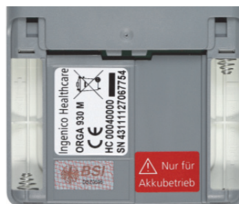
Abbildung 7: Typenschild des ORGA 930 M online mit Seriennummer