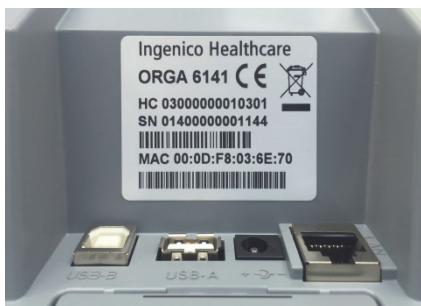
Abbildung 6: Typenschild des ORGA 6141 online mit Seriennummer und MAC-Adresse

Die Seriennummer und MAC-Adresse für das ORGA 6141 online und die Seriennummer des ORGA 930 M online finden Sie auf dem Typenschild des Terminals (siehe Abbildung 6 und 7) und über die Terminalselbstauskunft im Menü [ Status \32 ] beim ORGA 6141 online und unter [ Status \33 ] beim ORGA 930 M online.