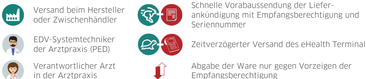
Abbildung 5: Schematische Darstellung der sicheren Lieferkette bei Direktversand in die Arztpraxis und Versand an einen professionellen endnutzernahen Dienstleister (PED)