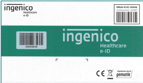
Abbildung 1: Verpackung des ORGA 6141 online mit intaktem Siegelband

Die Verpackung der Geräte ist rundherum mit einem Siegelband verschlossen und versiegelt, um es vor unerlaubtem Öffnen zu schützen. Anhand der Unversehrtheit der Verpackung und des Siegelbands können Sie überprüfen, ob die Verpackung auf dem Weg zu Ihnen geöffnet wurde.