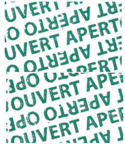
Abbildung 4: Fehlendes Siegelband

Bei dem unbeschädigten bzw. ungeöffneten Siegelband in Abbildung 1 schimmert ein diagonaler Text APERTO OPENED GEÖFFNET OVERT schwach durch die oberste Schicht der grünen Bereiche der Folie. Unter den weißen Bereichen (Ingenic Logo und Barcode-Feld) ist diese Schrift nicht zu sehen. Sobald das Siegelband von der Verpackung gezogen und anschließend wieder aufgebracht wird, verliert der Klebestreifen an Haftkraft und ist der diagonale Schriftzug deutlich unter der gesamten Oberfläche des Siegelbandes, so wie in Abbildung 3 dargestellt, zu erkennen. Wurde das Siegelband entfernt, bleibt der diagonale Schriftzug auf der Packung, so wie in Abbildung 4 zu sehen, haften.